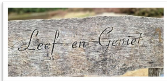
Kolping Wandergruppe WhatsApp-Gruppe